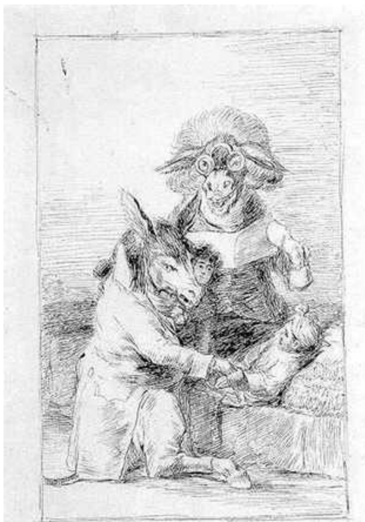
GOYA "Brujas disfrazadas de médicos"